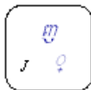
រូបភាព២.៣៖ គ្រាប់ចុច ុ (សញ្ញាដាក់ជើង)

អ្នកគួរកត់សម្គាល់ដែរថា ជើងព្យញ្ជនៈគឺមិនមាននៅលើការចុចដូច ពុម្ពអក្សរមុនៗ ( លីមុនអេប៊ីស៊ី ឬ ពុម្ពអក្សរផ្សេងទៀត ) ឡើយ ព្រោះថាក្នុងយូនីកូដព្យញ្ជនៈធម្មតា និង ជើងព្យញ្ជនៈ ត្រូវបានប្រើដោយគ្រាប់ចុចដូចគ្នា ។ ដើម្បីផ្តល់សញ្ញាថា ព្យញ្ជនៈបន្ទាប់ជាជើងព្យញ្ជនៈ គ្រាប់ចុច ុ (J) ត្រូវបានវាយមុនព្យញ្ជនៈ ៖